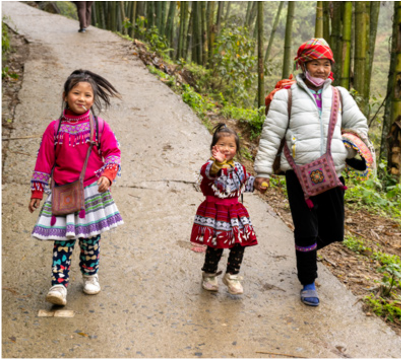
▲ Die stadslewe was 'n skrilte kontras met die stamlewe in die berge van Viëtnam.

en die jare daarna verhuis. Soms is hulle deur plaaslike owerhede gedwing om te trek en ander kere het hulle op versoek van kerkleiers verhuis. In plaas daarvan dat dit tot frustrasie of vrees gelei het, het die trekkery egter hul bedieningsgeleentheid vergroot en hulle toewyding aan die Here versterk.